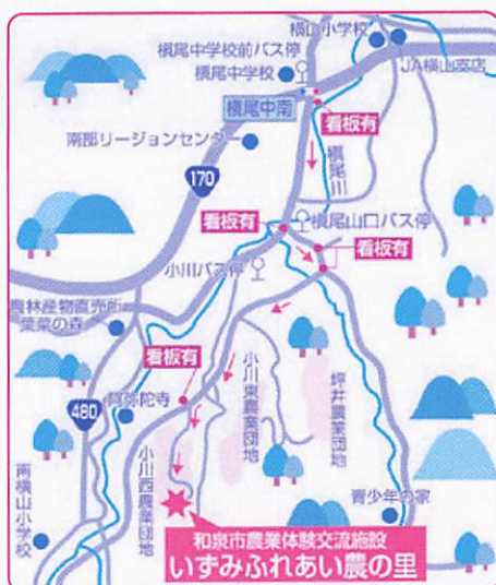
ふれあい農の里の地図