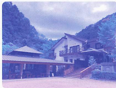
和泉市立青少年の家